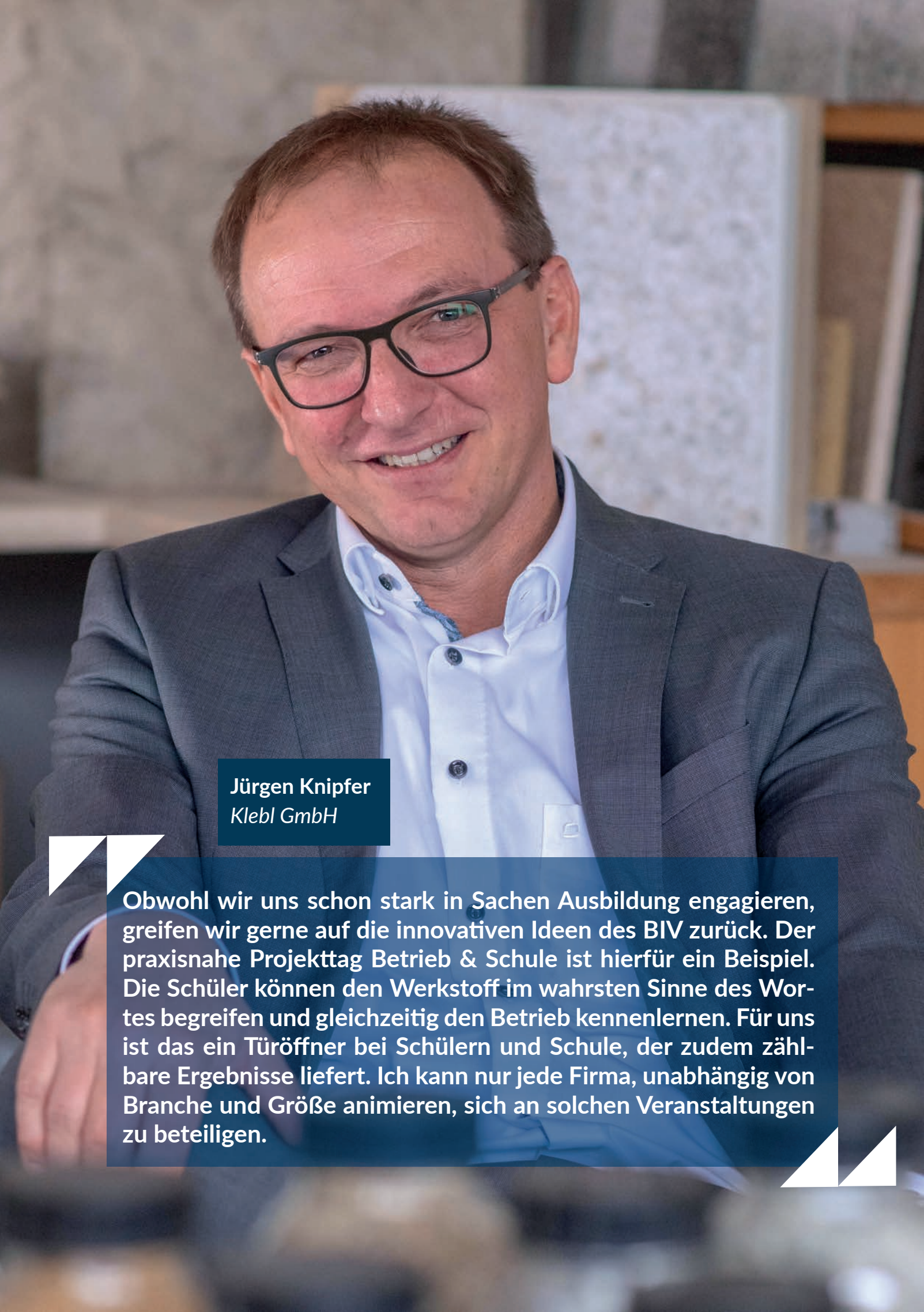
Jürgen Knipfer Klebl GmbH

Obwohl wir uns schon stark in Sachen Ausbildung engagieren, greifen wir gerne auf die innovativen Ideen des BIV zurück. Der praxisnahe Projekttag Betrieb & Schule ist hierfür ein Beispiel. Die Schüler können den Werkstoff im wahrsten Sinne des Wortes begreifen und gleichzeitig den Betrieb kennenlernen. Für uns ist das ein Türöffner bei Schülern und Schule, der zudem zählbare Ergebnisse liefert. Ich kann nur jede Firma, unabhängig von Branche und Größe animieren, sich an solchen Veranstaltungen zu beteiligen.