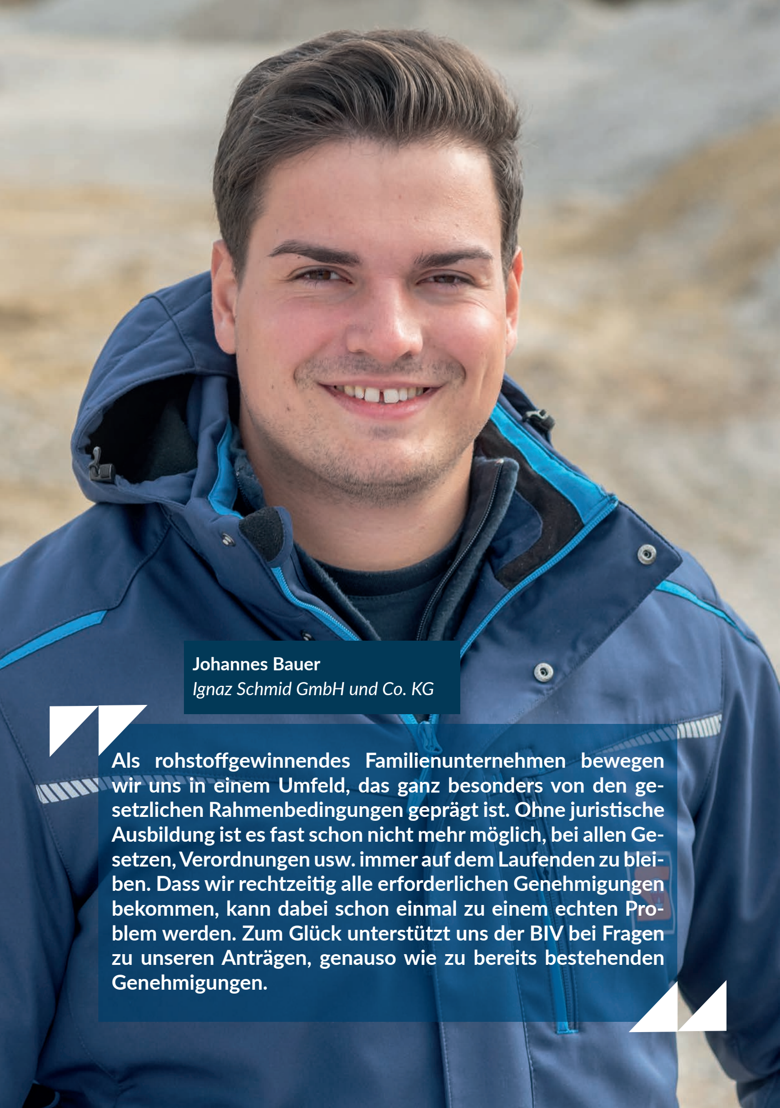
Johannes Bauer Ignaz Schmid GmbH und Co. KG

Als rohstoffgewinnendes Familienunternehmen bewegen wir uns in einem Umfeld, das ganz besonders von den gesetzlichen Rahmenbedingungen geprägt ist. Ohne juristische Ausbildung ist es fast schon nicht mehr möglich, bei allen Gesetzen, Verordnungen usw. immer auf dem Laufenden zu bleiben. Dass wir rechtzeitig alle erforderlichen Genehmigungen bekommen, kann dabei schon einmal zu einem echten Problem werden. Zum Glück unterstützt uns der BIV bei Fragen zu unseren Anträgen, genauso wie zu bereits bestehenden Genehmigungen.